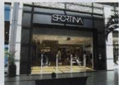
Letos je 280 trgovin Sportine Group obiskalo približno 3,5 milijona kupcev. Prodajalna Sportina Kranj

Sportina danes zastopa skoraj osemdeset blagovnih znamk v različnih cenovnih razredih, od srednjega cenovnega razreda do vrhunskih blagovnih znamk - vodilnih imen mode v svetu, kot so Armani, Burberry, Boss, Valentino, Cerruti, D&G in druge . Pridobitev slednjih je plod trdega dela in dolgoletnega dokazovanja strokovnosti in usposobljenosti zaposlenih v Sportini.