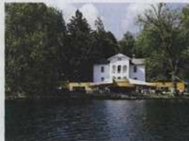
Vila Prešeren ne privlači le tujih, ampak tudi domače goste, ki jo radi obišejo ob koncu tedna.

Sportina Group je ena redkih slovenskih korporacij, ki se jim je v zadnjih letih uspelo uveljaviti zunaj slovenskih meja. Deluje v Sloveniji, Srbiji, Bolgariji, Bosni in Hercegovini, Črni gori, na Hrvaškem in Kosovu . Vodi poslovno politiko mednarodnega koncerna in usklajevati poslovanje z lokalnim družbenim gospodarskim in pravnim redom je zahtevan proces, hkrati pa tudi prednost in izziv za vse, ki delajo v Sportini. Osnovno poslanstvo Sportine, ki ga uveljavljajo na vseh trgih, je: ponuditi potrošnikom vrhunske blagovne znamke in storitve ter sooblikovati slog življenja. Zanimivo je, da kupci, ki kupujejo Tom Tailor, TALLY WEIJL, Bata, Esprit, Vero Moda, Orsay ipd. (vsak četrti Slovenec že kupuje v Sportininih trgovinah), ne vedo, da jih upravlja Sportina.